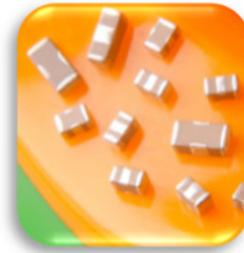
EMI X2Y Filter