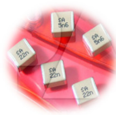
Safety X2Y3, X1Y2